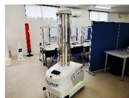
センター所有ロボットの一部

産業用ロボットを導入予定・取扱い予定の事業者の皆様！労働安全衛生法第59条第3項に基づき、労働安全衛生規則第36条第31・32号に定められた業務は安全特別教育の受講が必須です！