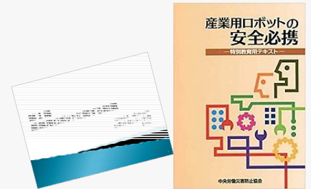
産業用ロボットの安全必携 —特別教育用テキスト—